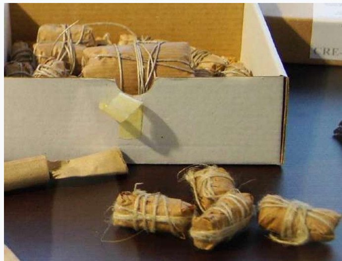
ANTICS "TRONS DE BAC"