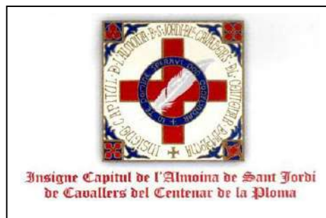
ESCUT DEL CENTENAR DE LA PLOMA

La Mostra, vulgo Quirdà o Cridà , té una antiguitat que escapa a tota investigació, ja que ja els templers quan prenen l'antiga ciutat de València (Balansiya) ja la fan; cosa que continuarà el Centenar de la Ploma o Milícia Valensiana. Milícia desmantellada després de la Batalla d'Almansa.