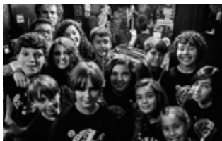
Sedajazz Kids Band

19:00 h DESFILADA DE LA SARDINA amb eixida des del parc de la Panderola ① i que recorrerà l'avinguda de Sant Pere, per a acabar de nou al parc de la Panderola amb l'acompanyament dels Botafocs i totes les persones que ho desitgen vestides de rigorós dol. A continuació ENTERRAMENT DE LA SARDINA , al parc de la Panderola ①, que posarà punt final al Carnestoltes 2018.