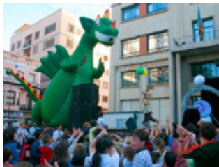
La Festa del Rei