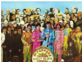
The Flaming Shakers